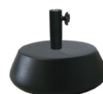
Bases de Sombrilla